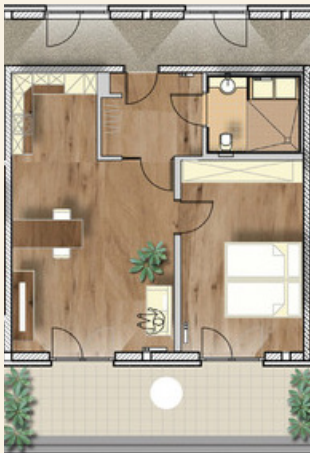
Typ C (1x)