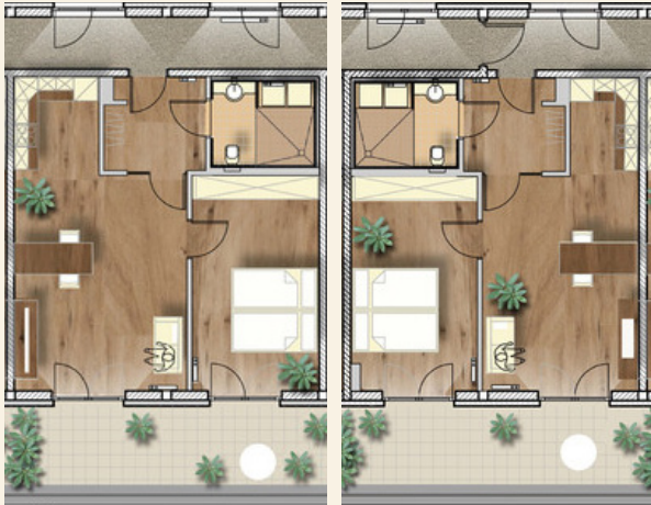
Typ A (8x)